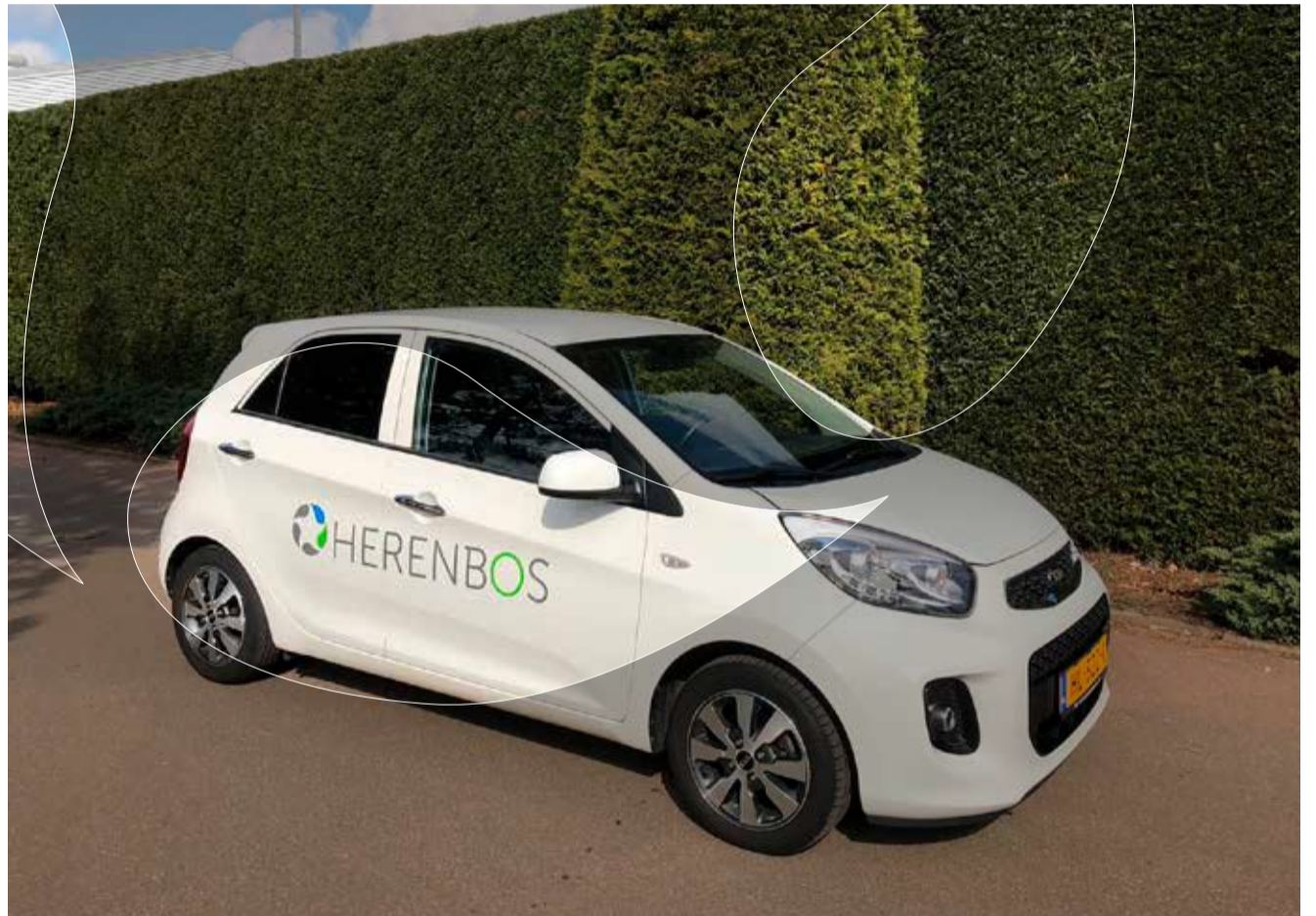
Eén van onze Herenbos-auto's met ons nieuwe logo

allemaal willen bedanken. We kijken met veel enthousiasme naar de toekomst en hopen je vanaf nu nóg beter van dienst te kunnen zijn.